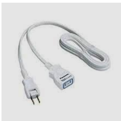
[使用可能] 延長コード 1 個口

(3) 一般家庭 (屋内) 用の延長コードを使用する場合、下記のような「延長コード 1 個口」をご用意ください。