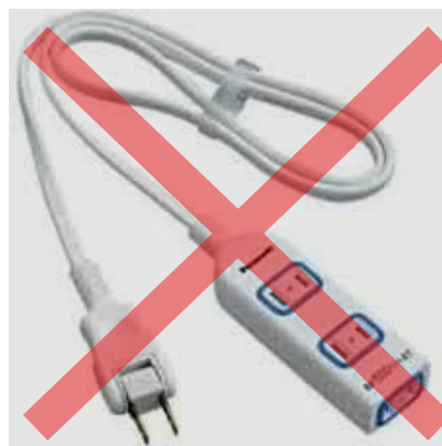
[使用不可] 延長コード 2 個口以上

※該当する延長コードを所持していない場合は、絶縁ビニールテープ等で使用できるコンセントを 1 個口にしてご使用ください。