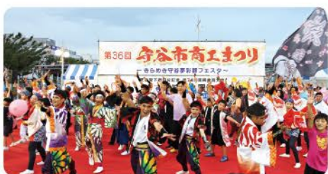
ステージ出演者のお申し込みも、守谷市商工会ホームページにてご確認ください。

第37回守谷市商工まつり 7月31日(月) 17時 申し込みの締め切りは7月31日(月) 17時です。お申し込みは、守谷市商工会ホームページにてご確認ください。